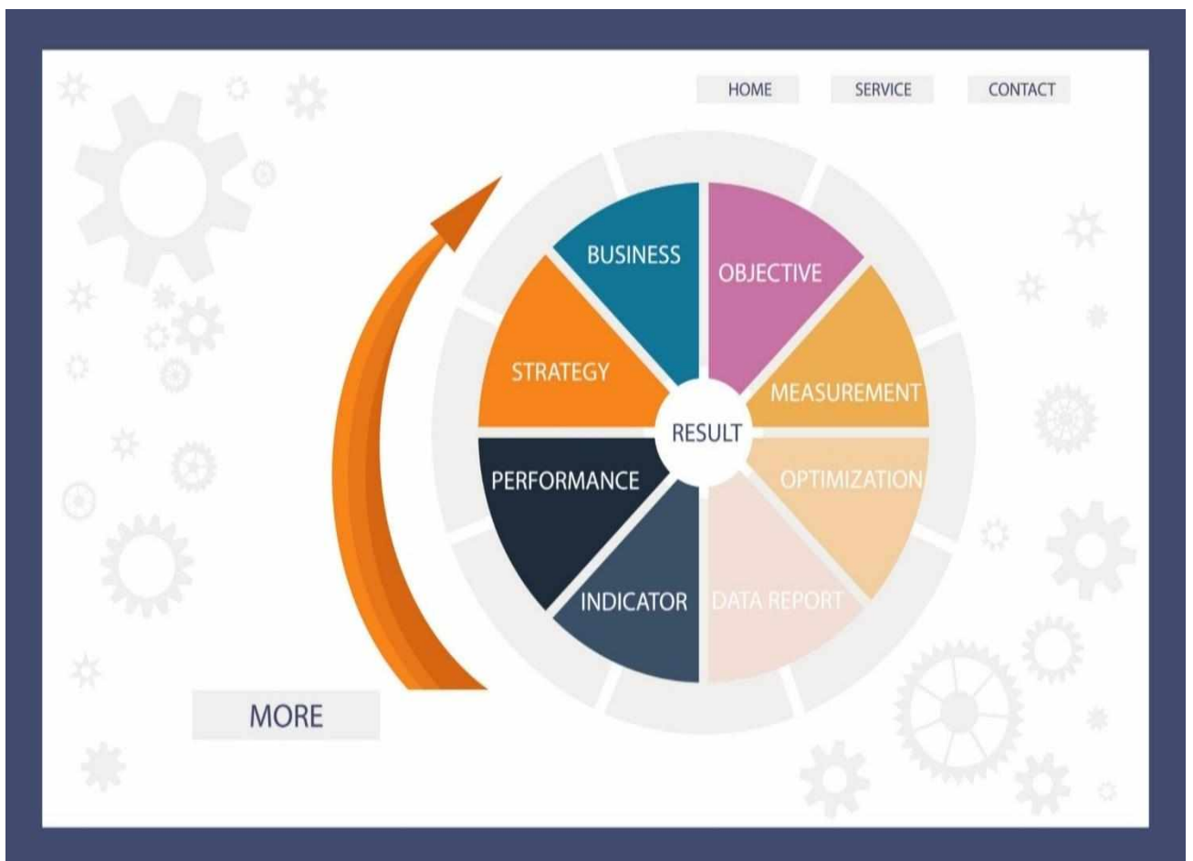
Рис.1.1 – Методологія проведення моніторингу

Моніторинг реалізації Стратегії розвитку Гірської сільської територіальної громади здійснювався на основі Методичних рекомендацій щодо порядку розроблення, затвердження, реалізації, проведення моніторингу та оцінювання реалізації стратегій розвитку територіальних громад, затверджених наказом Міністерства розвитку громад та територій України від 21.12.2022 №265 за допомогою відповідної методології, рис.1.1.