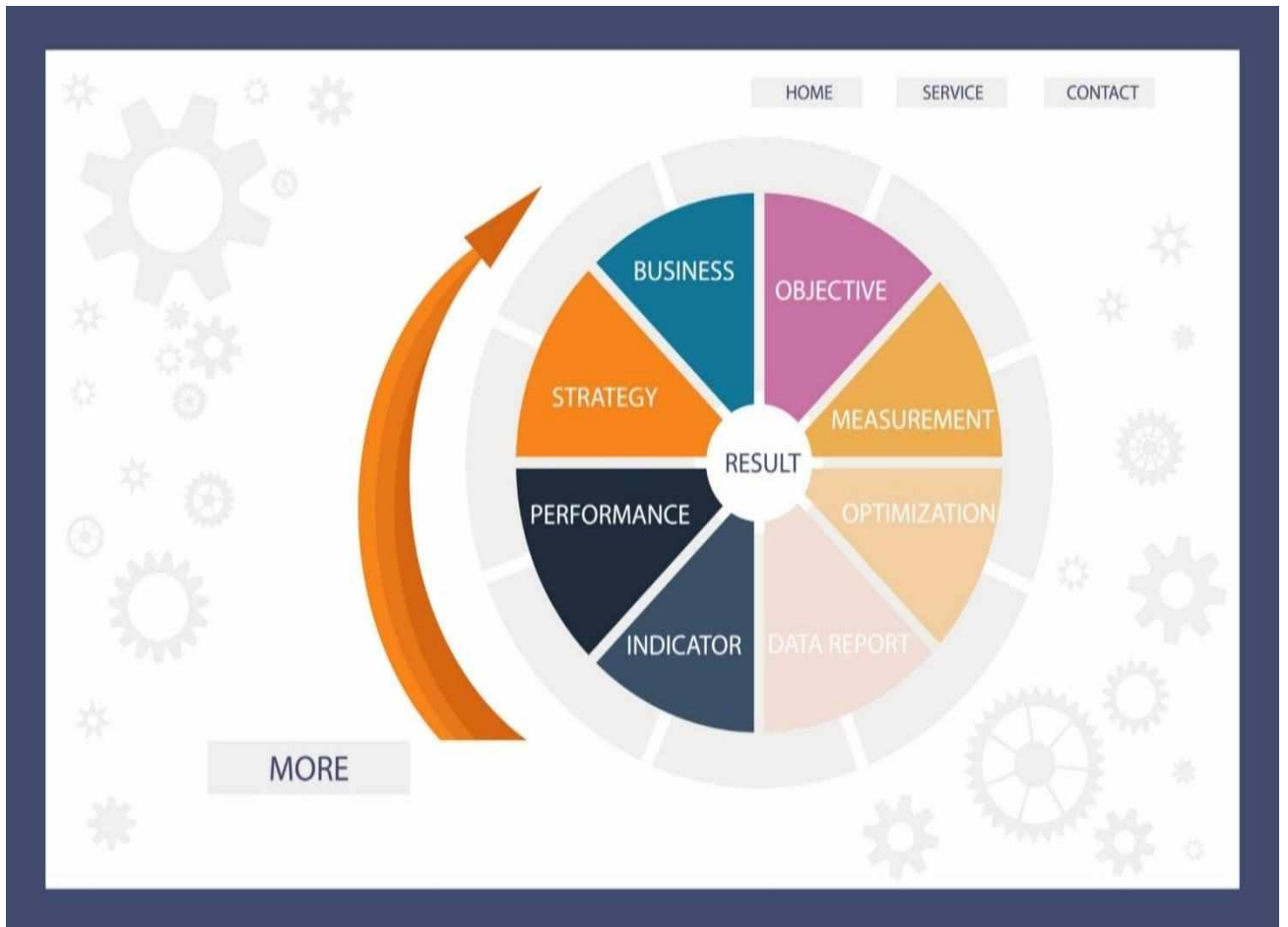
Рис.1.1 – Методологія проведення моніторингу

Для проведення оцінювання використовувались: інформація структурних підрозділів Гірської сільської ради; дані комунальних підприємств; внутрішня статистика виконавчих органів; матеріали фінансової та бюджетної звітності; таблиці моніторингу виконання Стратегії та Плану заходів.