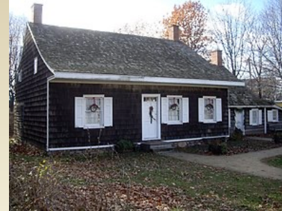
Будинок (із земельною ділянкою)*

*Якщо Ви купите приватний будинок, компенсація може надаватись і на придбання земельної ділянки, на якій розміщується будинок